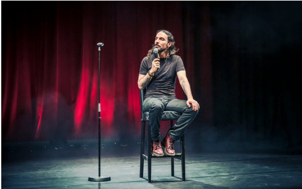
Dans «Biafine», Dedo pose un regard délicieusement absurde sur un monde «où tout est devenu n'importe quoi». Benjamin Delacoux