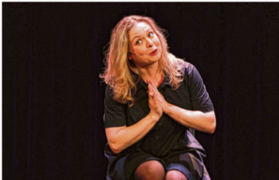
Constance sera sur la scène de la Comédie d'Aix vendredi 12 et samedi 13 avril dès 21 h 30.

Après une absence pour soigner une dépression, l'humoriste Constance revient vendredi et samedi à Aix. Pour reprendre la main et casser les tabous.